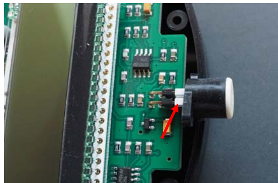
Ultraschallsensor auf den Stecker setzen, Weiße Markierung zeigt nach oben!