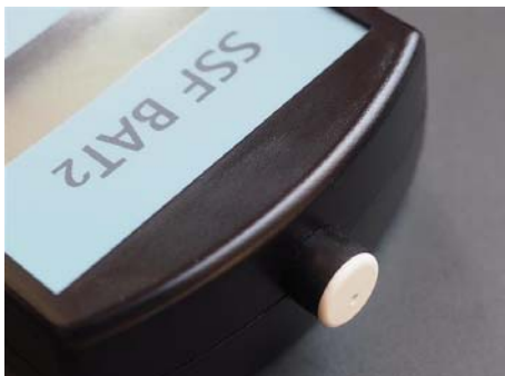
Platine nach unten drücken, Gehäuse schließen und festschrauben. Fertig zum Testen...