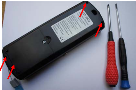
Lösen von 4 Gehäuseschrauben